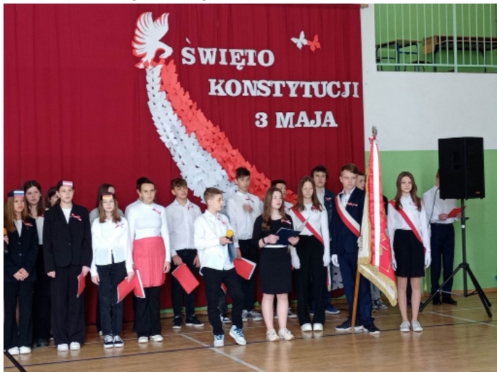
Sztandar ZS Nr 1 oraz uczniowie w czasie uroczystej Akademii z okazji obchodów Święta Konstytucji 3 maja.

Uczniowie wszystkich klas przyszli ubrani w stroje galowe, odbył się apel, podczas którego występujący słowami wierszy, piosenek i patriotycznego tańca uczcili rocznicę uchwalenia Konstytucji 3 Maja. Przedszkolaki z grupy 4-latków i dwóch grup 6-latków wraz z wychowawczyniami wzięły udział w marszu patriotycznym po Nienadówce.