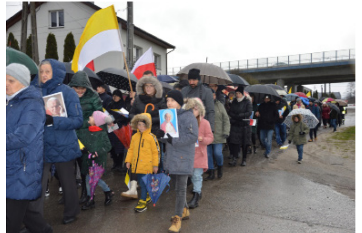
Marsz parafian w obronie św. Jana Pawła II